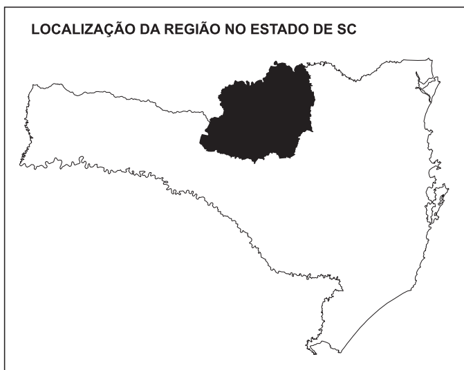
Ilustração 1: Mapa da Localização da Região do Contestado em SC.

Na região do Contestado, a economia solidária, que pretendemos descrever, se destaca a partir da década de 1990. Esses empreendimentos surgem a partir das relações com sindicatos de trabalhadores, com o Movimento dos Trabalhadores Rurais Sem-Terra - MST, as associações de mulheres, as pastorais sociais, isto é, com fortes vínculos comunitários e sociais. Também surgem como alternativas à crise na agricultura familiar integrada à agroindústria e ao desemprego no meio urbano. O Fundo Rotativo dos Mini-Projetos Alternativos – MPAs 3 incentivou várias experiências comunitárias de geração de trabalho e renda a grupos denominados coletivos, com atividades alternativas. Esse Fundo foi implantado no segundo semestre de 1994, em Santa Catarina. O apoio financeiro consiste num empréstimo a ser devolvido em quatro anos, vindo a constituir um fundo que servirá para outros empréstimos a novos empreendimentos. Por isso, o nome de rotativo.